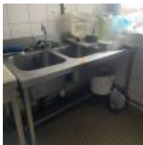
Table inox plateau polyéthylène (d'environ 90X160X70) Mise à prix :