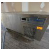
Table inox 120 cm Mise à prix : 100€