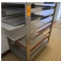
Table inox à dossier avec tablette d'entre-jambe Mise à prix : 100€