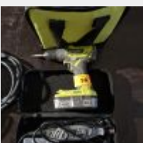
Lot n° 58 DREMEL, Visseuse RYOBI, 2 accus, 1 chargeur Mise à prix : 50€