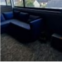
Lot n° 54 6 Chaises d'écolier, Micro-ondes, Chaise sur roulettes, Canapé d'angle Mise à prix : 50€