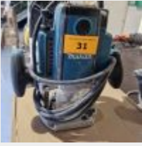
Lot n° 31 Défonceuse MAKITA RP1800 Mise à prix : 40 €