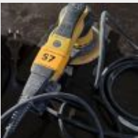
Lot n° 57 Ponceuse MIRKA Mise à prix : 30€