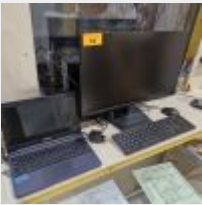
Lot n° 50 Ordinateur portable ASUS avec alimentation Mdp : 0327 Ordinateur ESSENTIEL avec unité centrale Mdp : 0327 Mise à prix : 80€