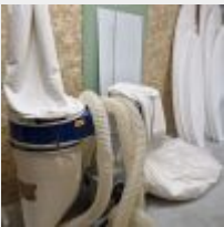
Lot n° 51 Centrale d'aspiration "Jean l'ébéniste", 06/2021 Mise à prix : 200€