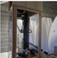
Lot n° 75 Imprimante 3D FYLSUN 400 avec consommable (12 bobines) et 2 tréteaux noirs Mise à prix : 150 €