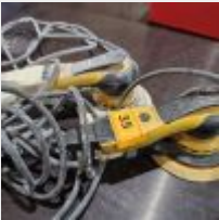
Lot n° 35 2 Ponceuses MIRKA Mise à prix : 40€