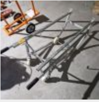
Lot n° 70.1 Porte-fût Mise à prix : 20 €