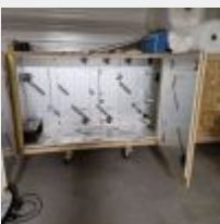
Lot n° 52 Etuve artisanale en bois Mise à prix : 100€