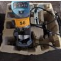
Lot n° 56 Affleureuse KATSU Mise à prix : 30€