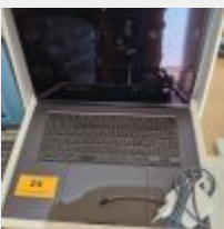
Lot n° 24 Macbook air 15 pouces 8GB memory 256GB SSD avec alimentation Mdp : Cutback03042023h Mise à prix : 250 €