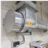
Lot n° 46 Turbine d'aspiration basse ronde avec variateur Mise à prix : 150€