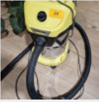
Lot n° 20 4 Caissons, Siège de bureau, Aspirateur Mise à prix : 70 €