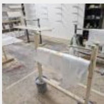
Lot n° 47 Lot de produits entamés (la plupart pas utilisable), 4 Chevalets, Résine et fibre, 4 Supports de planche Mise à prix : 50€