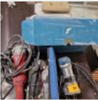
Lot n° 34 Affleureuse MAKITA avec fraises, Lot de 9 gabarits de découpe, DREMEL, Polisseuse MILWAUKEE (alimentation à revoir), Couteau à polystyrène, Rape Mise à prix : 30€