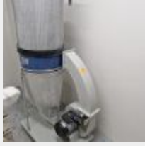
Lot n° 43 Aspiration HBM 200 PROFI, 2021, 230V Mise à prix : 100€