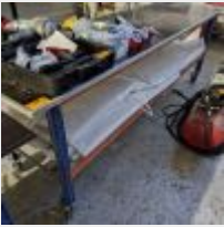
Lot n° 72 Table sur roulettes Mise à prix : 20 €