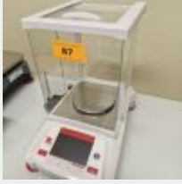
Lot n° 87 Balance précision OHAUS AX 623 Achetée 2 139 €TTC Mise à prix : 150 €