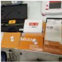
Lot n° 89 Duromètre RS Accessoires (thermohygro TESTO, enregistreur TESTO, autres accessoires) Micromètre, pied à coulisse, câbles MITUTOYO Mise à prix : 80 €