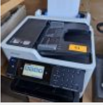
Lot n° 21 Multifonction EPSON workforce pro WF. C5790, scanette, imprimante EPSON Mise à prix : 50 €