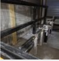
Lot n° 49 Fraiseuse CNC Tech KM System 4 axes, 2021 Financée 63 492€ (facture sur demande à l'étude) Mise à prix : 8000€ Vendue par la SVV ADJUGE, à la requête d'un établissement financier, Frais de vente 24% TTC