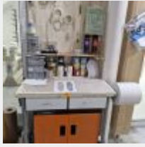
Lot n° 42 Table haute, Armoire MAGNUSSON garnie de peinture Mise à prix : 50€