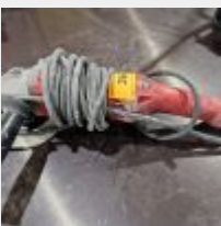
Lot n° 36 Polisseuse MILWAUKEE (fonctionne au 21/11) Mise à prix : 40€