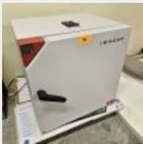
Lot n° 90 Étuve Drying and Heating chamber Solid.line FDS 56 (1 524.24 € TTC) Mise à prix : 350 €