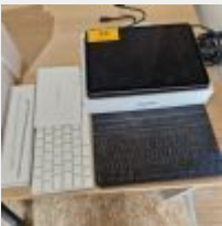
Lot n° 23 Ipad pro 11, 256GB, 2021, avec 2 claviers, 1 stylet sans alimentation, avec cordons Mdp : 123540 Mise à prix : 100 €