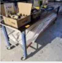
Lot n° 71 Table sur roulettes Mise à prix : 20 €