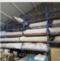
Lot n° 76 Rack 5 travées, 6 échelles, 60 lisses (Cellule 11) Mise à prix : 700 €