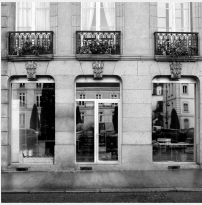
Lot n° 49.1 Système d'aspiration A démonter proprement Mise à prix : 300€