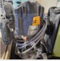
Lot n° 32 Défonceuse DEXTER POWER Visseuse RYOBI, 2 accus, 1 chargeur, dans sa sacoche Mise à prix : 40€