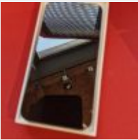
Lot n° 22.1 Iphone 13 Mise à prix : 100 €