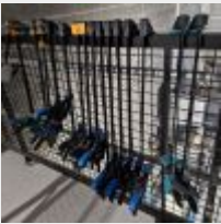
Lot n° 74 29 Serre-joints, 2 Tréteaux réglables métalliques Mise à prix : 250 €