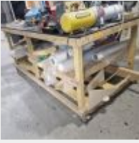
Lot n° 48 Table roulante de préparation en bois avec 4 tréteaux Mise à prix : 50€