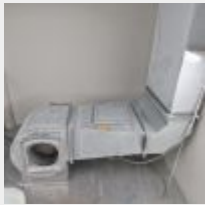
Lot n° 45 Turbine d'aspiration en galva rectangulaire avec variateur Mise à prix : 200€