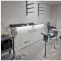
Lot n° 44 8 Supports de planche, 2 Chevalets de planche, 2 Etagères PVS, Boîte d'abrasifs Mise à prix : 100€