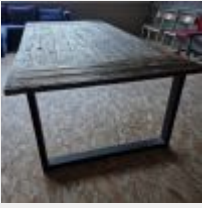
Lot n° 53 Table en bois Mise à prix : 100€