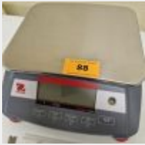
Lot n° 88 Balance OHAUS ranger 3000 Mise à prix : 50 €