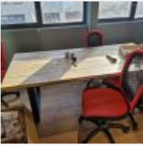
Lot n° 22 Table rectangulaire plateau bois piétement métal, 5 Sièges sur roulettes, Paperboard, Carton de fournitures Mise à prix : 100 €