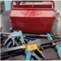
Lot n° 33 5 Serres-joints WOLCRAFT, Caisse à outils métal Mise à prix : 30€