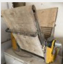
Lot n° 45.1 Laminoir RONDO, fonctionne, mauvais état Congélateur et micro-ondes (état moyen), fonctionne Mise à prix : 100€