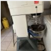
Lot n° 44.1 Batteur PUMA ELECTROLUX avec cuve 20 Litres et accessoires (problème électrique, à réviser ) Mise à prix : 50€