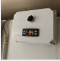
Lot n° 42 Chambre froide positive (fonctionne), environ 2 x 1 m avec angle (A démonter sans endommager le local) Mise à prix : 200€