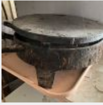
Lot n° 41 Galetière 3 Bouteilles de gaz Mise à prix : 40€