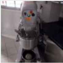
Lot n° 44 Batteur TEKNO STAMAP TIM V400/5/3 avec 2 bols inox 50 et 25L, 2 fouets, 2 crochets, 2 feuilles Année 2005 Se trouvant à RENNES Mise à prix : 900€ Vendu sur désignation Exposition le 14 avril de 9h30 à 10h, 42 rue Saint Georges à RENNES Enlèvement le 22 avril à 15h Suite LJS SARL CG, à la requête du TC de RENNES, Me BRILLAUD MJ